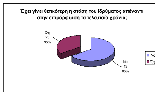
Εικόνα 2 Αλλαγή στη στάση της Διοίκησης

Ακόμη το 47% πιστεύει ότι η Διοίκηση των Ιδρυμάτων αξιοποιεί ελάχιστα τις γνώσεις και δεξιότητες που αποκτά μέσω της επιμόρφωσης, ενώ το 9% θεωρεί ότι δεν αξιοποιούνται καθόλου. Αντίθετα ένα ποσοστό της τάξης του 31% πιστεύει ότι οι νέες γνώσεις και δεξιότητές του αξιοποιούνται σε μέτριο βαθμό.